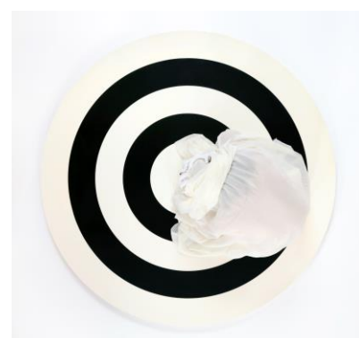
Sophia Kalkau: Line of Circles , 2016